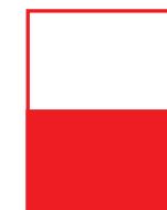
1/2 PAGE HORIZONTALE 215 mm x 137,5 mm