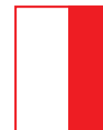
1/2 PAGE VERTICALE 107,5 mm x 275 mm