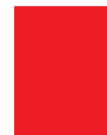
PAGE SIMPLE 215 mm x 275 mm

[LARGEUR X HAUTEUR + 5mm de débord de chaque côté]