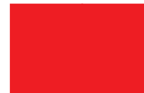
DOUBLE PAGE 430 mm x 275 mm