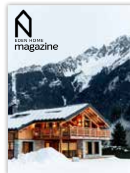
Magazine Eden Home