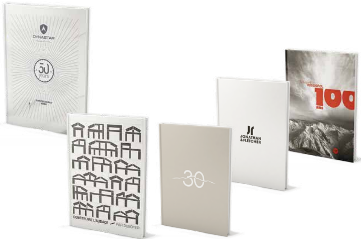
Beau-Livre « 50 ans de Dynastar »