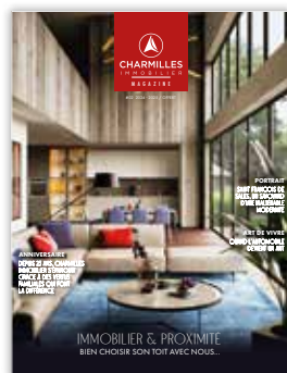
Magazine Charmilles Immobilier