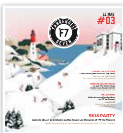
Magazine Fahrenheit Seven

Pour bon nombre de bonnes raisons selon nous : parce qu'il est émotionnel et offre une expérience sensorielle unique ; parce qu'il est conçu sur-mesure et permet d'ancrer l'identité des marques et valoriser leur savoir-faire ; parce qu'il est authentique et sécurisant, un écrit reste, il ne s'efface pas ; parce qu'il est inventif et créatif grâce aux innovations de l'impression ; parce qu'il est engagé et responsable à l'image du papier dont la production provient quasi intégralement de forêts gérées durablement ; enfin parce qu'il crée l'effet surprise, à tel point que de nouvelles marques du digital et du e-commerce ont elles mêmes recours à ce support de référence qu'est le magazine !