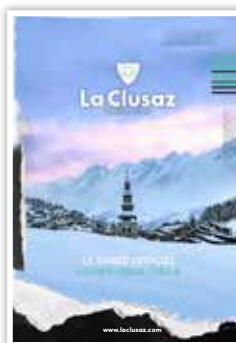
Guide La Clusaz