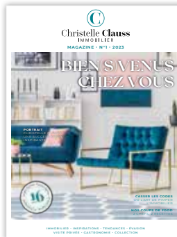
Magazine Christelle Claus Immobilier