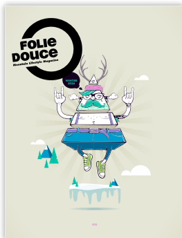
Magazine Folie Douce