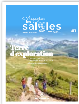
Magazine Les Saisies