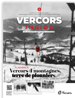
Magazine Vercors Inside