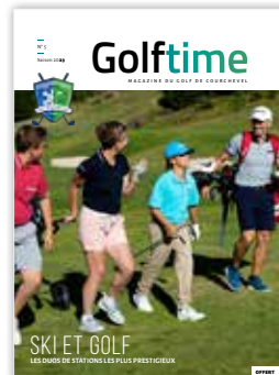
Magazine Golf de Courchevel